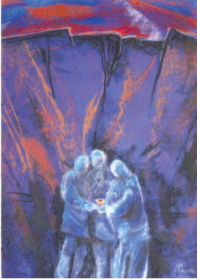
(Folytatás a 3. oldalról)

Ez az idézet évekkkel ezelőtti, fájdalmas és szörnyű, hogy Kárpátalján ma is kifejezetten időszerűek a magyar nyelv és a magyar nyelvű oktatás megvédésére felhívó szavak! Az ukrán vezetés, az ukrán politikai elit támogatja, és szerzett jogaitól, köztük iskoláiban az anyanyelv oktatásától, használatától megfosztani igyekszik az ország lakosságához képest maroknyi magyar közösséget.