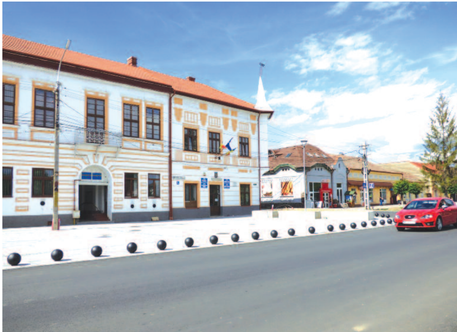
Még ridegnek tűnik, de hamarosan elnyeri végső formáját a főtér alsó szakasza