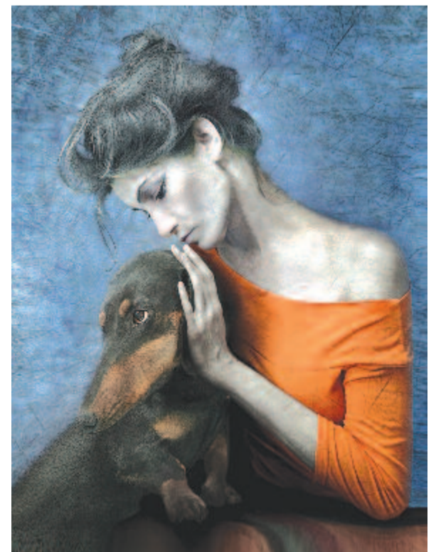
Ivano Frankivsk (Ukrajna) fotója